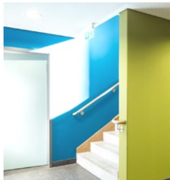
Das durchgehende Material- und Farbkonzept reagiert auf die Anforderungen aus Schule und Sport.