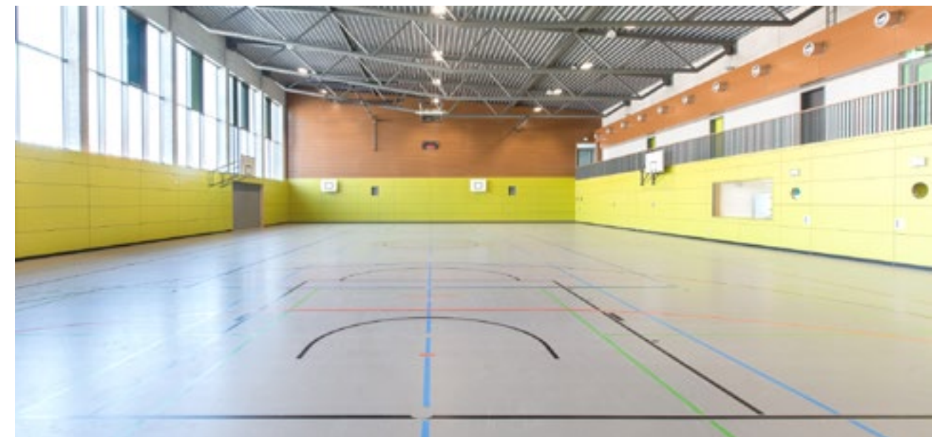
Die nordseitige Glasfassade ist blendfrei, die Halle ist 1/3 zu 2/3 teilbar, bietet großzügige Geräte Räume und vier getrennte, aber koppelbare Umkleibereiche.