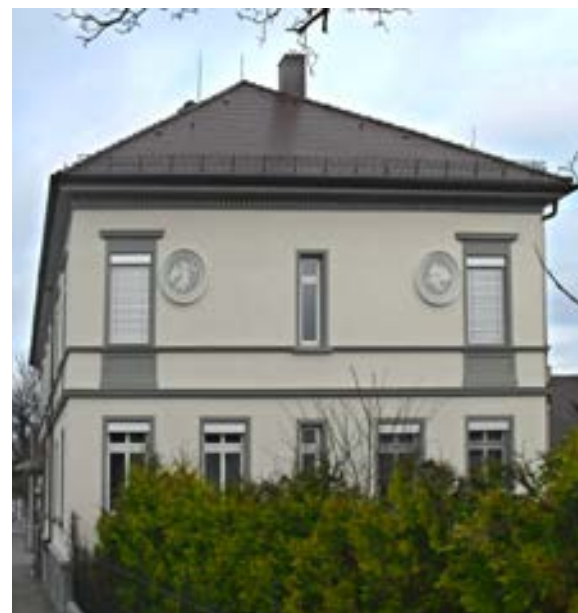
Das historische Foto aus den 1920er-Jahren und eines aus der Zeit vor dem Dachgeschossausbau verraten nicht, was unter dem Dach an Juwelen zu finden ist.