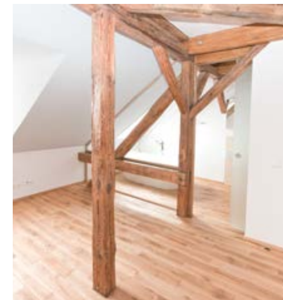
Die Holzkonstruktion dient auch heute der Raumgliederung – eine gläserne Wand lässt den Blick vom Schlafzimmer auf die freistehende Wanne bewusst zu.