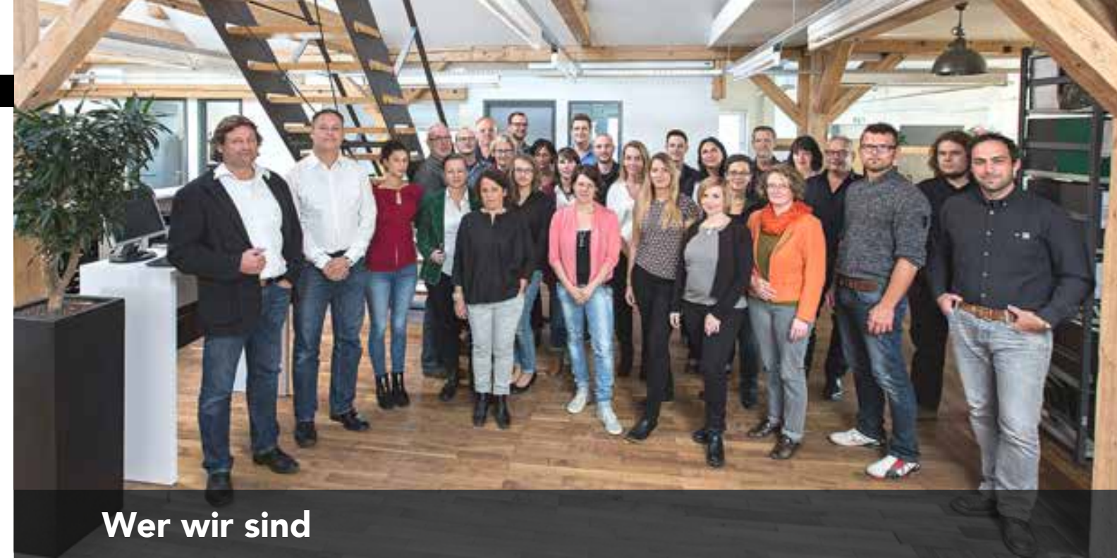
Wer wir sind